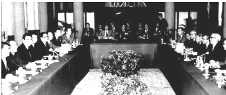
Dân, Lý Bằng,

Hy vọng kết quả của những việc làm này sẽ là nguồn nhiên liệu thiết yếu hỗ trợ cho lửa thiêng ở trong nước bùng mạnh liên tục quyết liệt rộng khắp trên đất nước Việt Nam, để nhanh chóng đốt cháy “tập đoàn Việt Cộng Mafia Tư bản Đỏ” sớm tan thành tro bụi, cho toàn dân tộc Việt Nam thoát khỏi ách cai trị bạo tàn vô nhân phi nghĩa của chúng từ suốt hơn nửa Thế kỷ nay, cũng như tránh cho Dân tộc khỏi bị thuần hoá thành dân thiểu số của tỉnh Việt Nam trong Đại Lục Trung Quốc mà Hội nghị bí mật tại Thành Đô năm 1990 với sự hiện diện của bè lũ lãnh đạo Việt Cộng gồm có Nguyễn Văn Linh, Lê Khả Phiêu, Đỗ Mười, Lê Đức Anh, Nông Đức Mạnh, phía Trung Cộng gồm có Giang Trạch